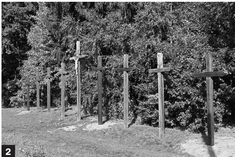
Pomník devíti křížů je monumentální a respekt vzbuzující památník, který skrývá pověst o temné tragédii