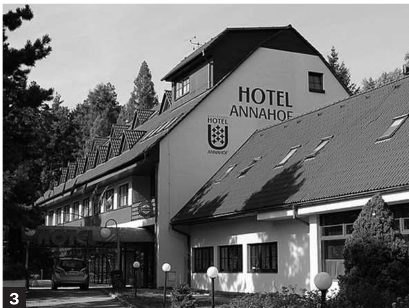
Slavný motorest je oblíbeným cílem zastávky řidičů